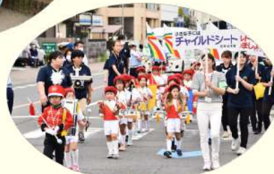
交通安全パレード