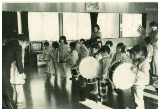
画像：1972年 開園当初の若草幼稚園