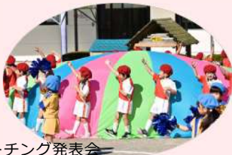
マーチング発表会